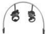
hrazdička s hračkami