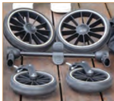
Přední kola Zadní kola